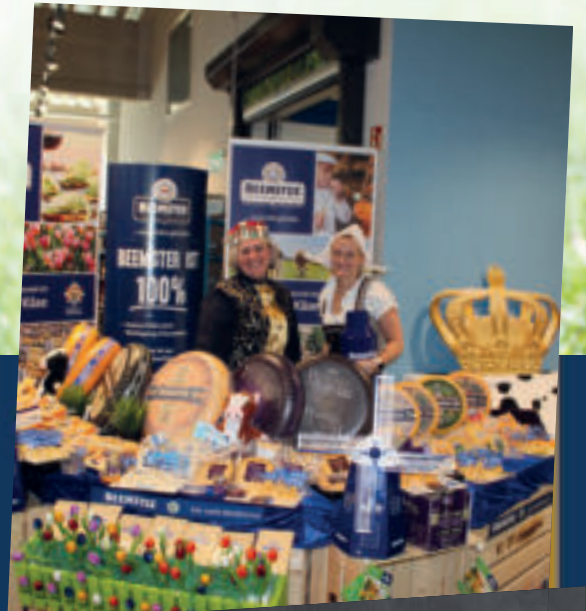
Am 1. Juni organisierte Warncke's EDEKA Frischecenter eine große Beemster Kinderaktion im Markt in Neugraben mit einem aufregenden Parcours und tollen Preisen für die Kleinsten sowie selbst gemachten Beemster-Snacks für die Erwachsenen.