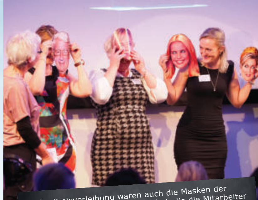
Bei der Preisverleihung waren auch die Masken der niederländischen Prominenten dabei, die die Mitarbeiter von Warncke's Frischecenter bei der Erstellung des Rudi-Carrell-Show-Videos getragen haben.

Ein abwechslungsreiches Gesamtpaket, das die Jury vollends überzeugte. Vor allem die Teamleistung und Kreativität hoben die Fachleute in ihrer Begründung für den Sieg von Warncke's Frischecenter lobend hervor: „Sie haben nicht nur uns, sondern vor allem Ihre Kundschaft überrascht. Der Teamgeist, der Esprit, die Kreativität und das Talent für aufmerksamkeitsstarke Präsentationen sind unübersehbar. Mit der filmreifen Promi-Käse-Show, mit dem Spaß